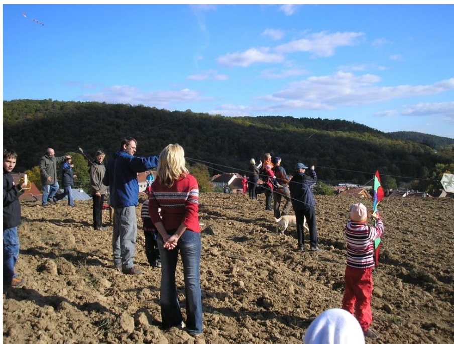
...a draci se nedali dlouho pobízet...