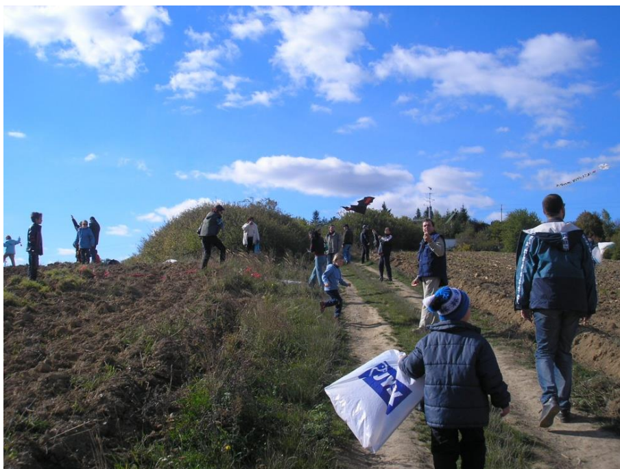
Rychle na kopec, dokud vítr fouká...