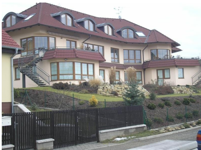
Jeden z domů nad obcí