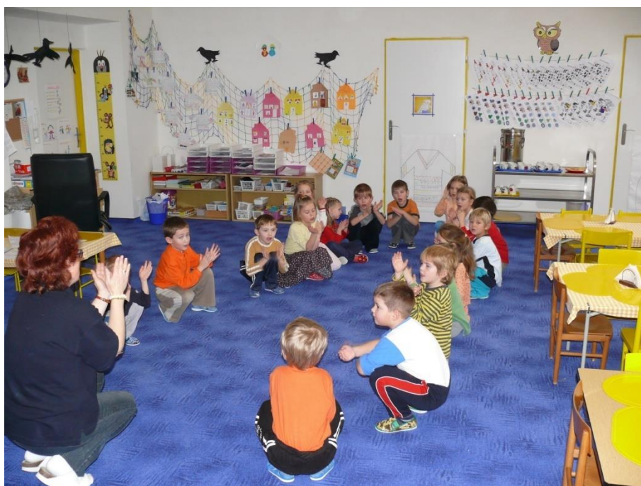
Do dvoutřídní MŠ dochází 50 dětí ve věku od 3 do 7 let.