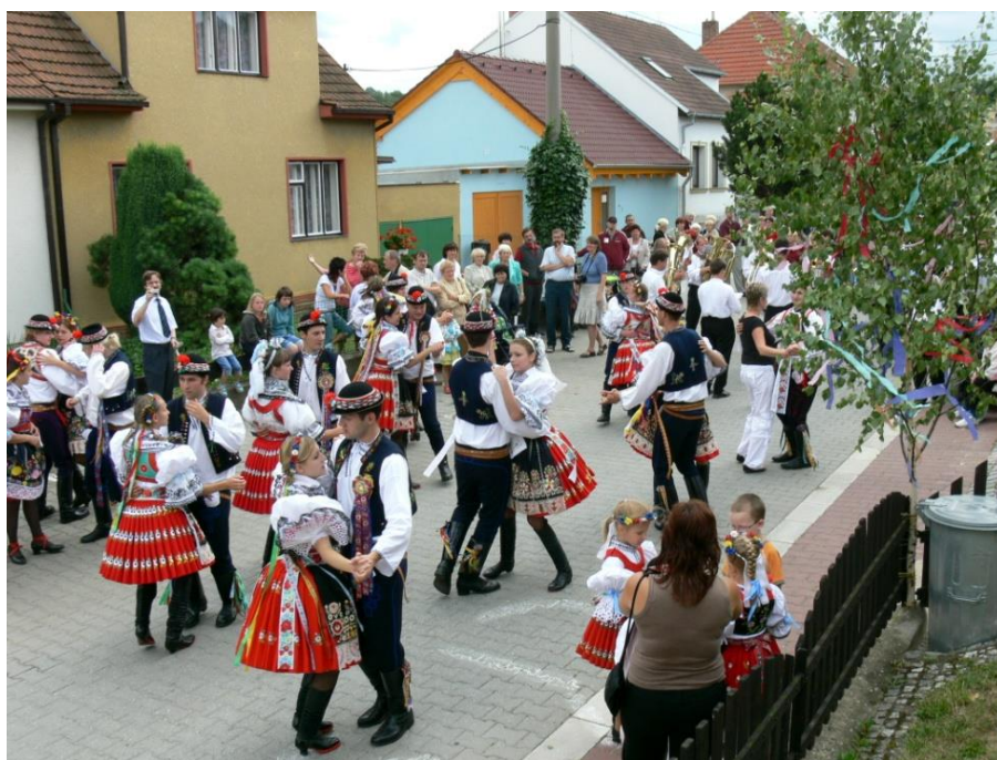
Před domem jedné ze stárek se průvod zastavil a dal se do tance