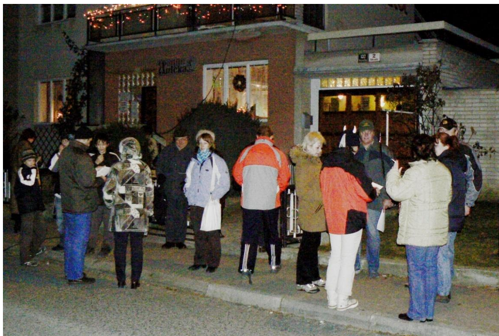
Koledovalo se u Aničky.

Na Štědrý večer při koledování se sešla asi třicítka sousedů před cukrárnou Anička, aby se děti pochlubily tím, co přinesl Ježíšek, aby si všichni zazpívali koledy, popřáli si hezké vánoce a v garáži pana Tesaře poklábosili s přáteli. Bylo to příjemné ukončení vánočního shonu a pěkná tečka za Štědrým dnem, která nahradila televizní zábavu. Organizátoři ze SOPKY věří, že příští rok se sejde spoluobčanů ještě více.