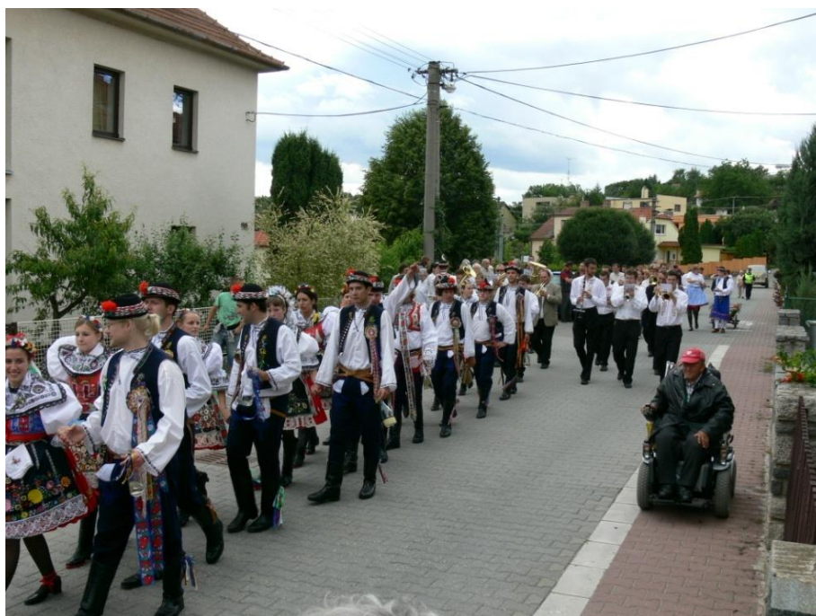
Za nimi 12 krojovaných párů s vyhrávající Zlaňankou