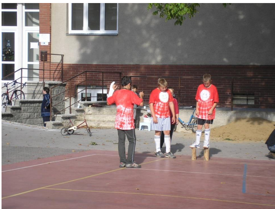
...při soutěži radili i soupeři.