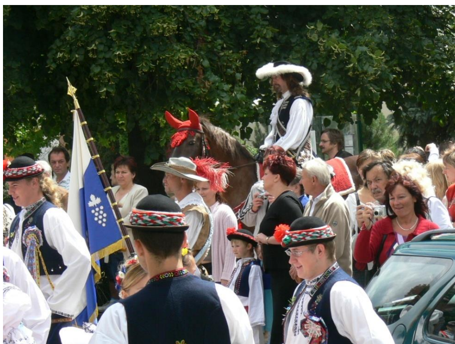
Druhý den hodů začíná dopoledním předáním hodového práva...