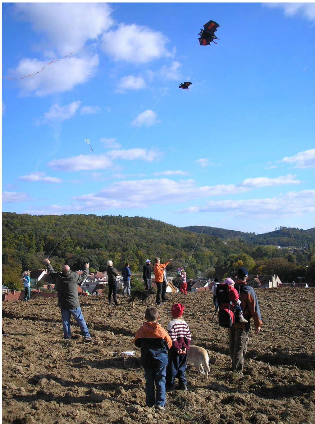
Sobotní odpoledne se vydařilo.