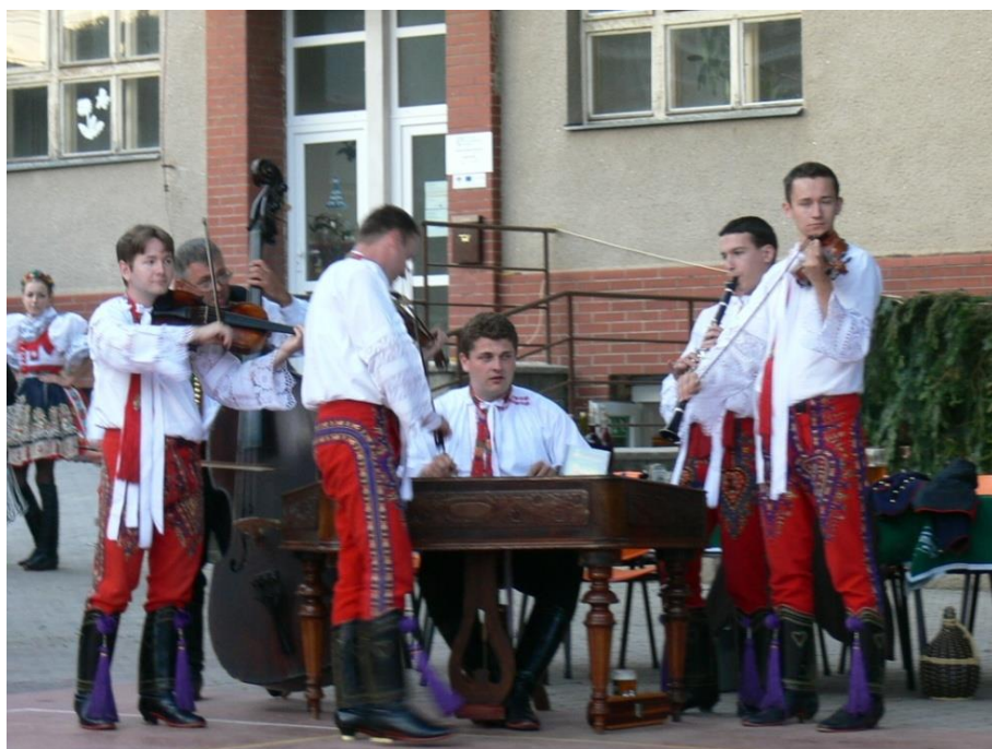
Předhodová zábava s cimbálovou muzikou Slovácko mladší může začít.