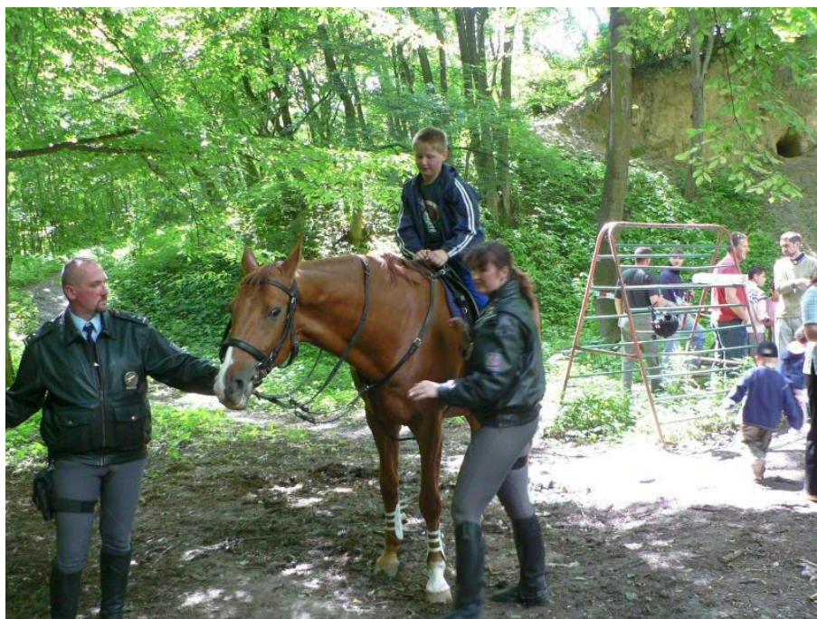
Lákala jízda na koni...