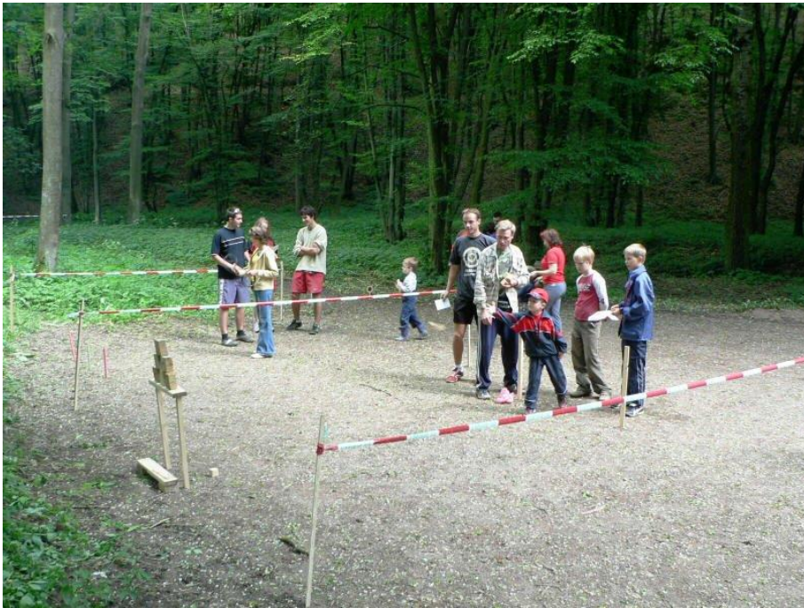
Shodit kostky míčkem je stejně těžké...