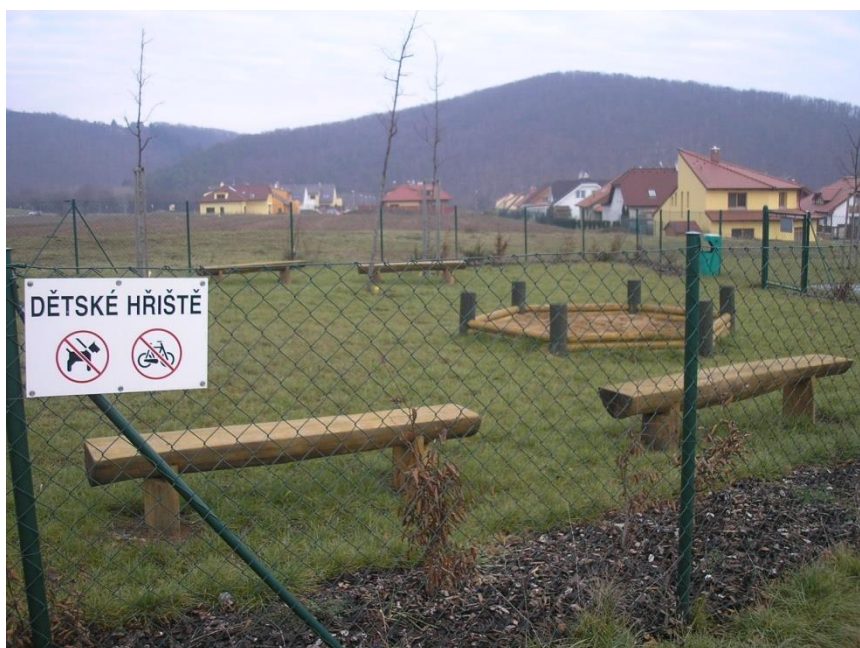
Pohled na obec od dětského hřiště za ulicí Ambrožovou

V tomto roce měla obec 14 ulic: Ambrožova, Dolní louky, Hrázní, Hluboček, K Lesu, K Bukovinám, Místní, Nová, Ondrova, Přehradní, Rekreační, Šikulova, ULuhu, U Památníku. Přihlášených obyvatel bylo 784, ale žije jich tu odhadem až 1000.