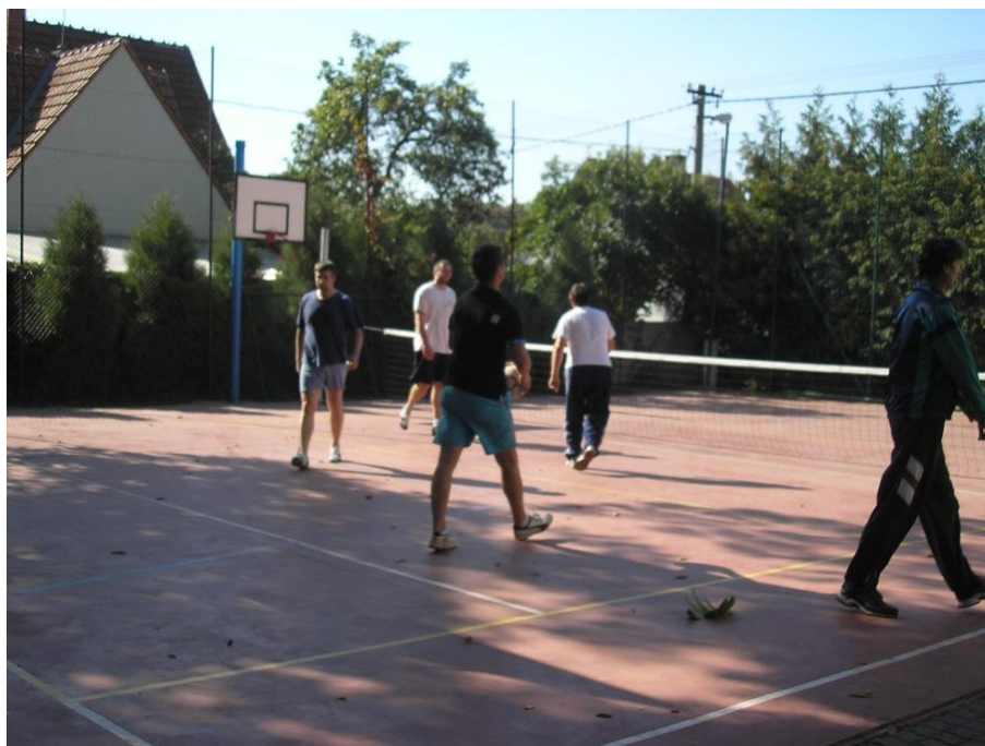
Dospělí se utkali v nohejbalu...