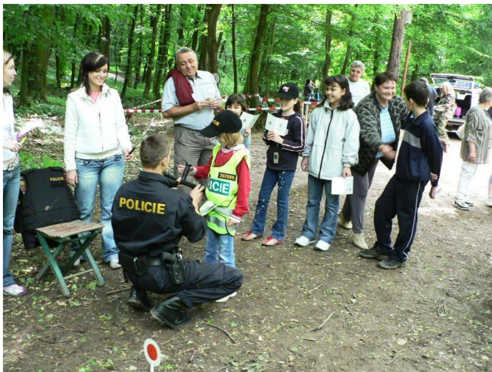
Dobrou náladu malých i dospělých dokumentuje tento snímek.

V krásném lesním areálu se hned 1. 6. 2007 sešly děti, aby společně oslavily svůj svátek všech dětí. Za účasti městské policie se svezly na koních i na služebních motorkách. Zkusily si střílení ze vzduchovek, zasoutěžily si a na závěr si opekly tradiční špekáčky. Protože se jim odpoledne líbilo, domluvily se, že se za rok sejdou zase.