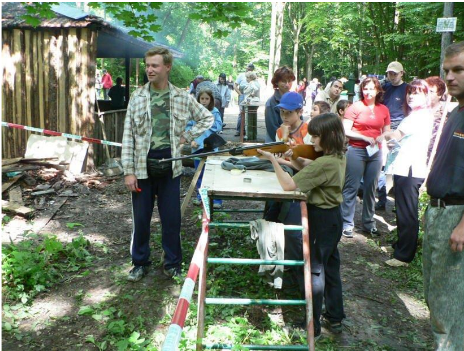
...jako zasáhnout terč ze vzduchovky.