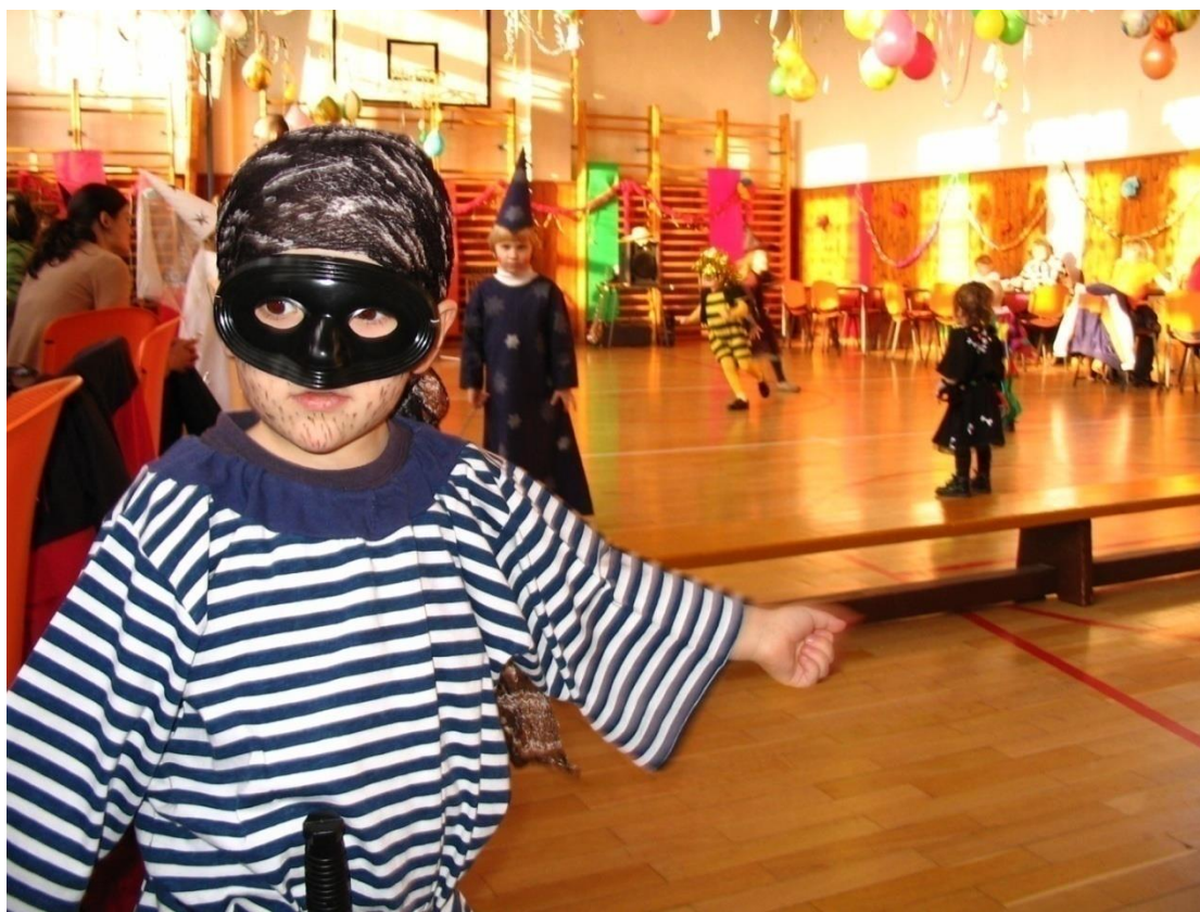
Pohled do vyzdobené tělocvičny