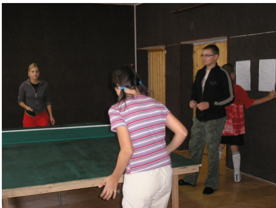
Mladí hráli stolní tenis...