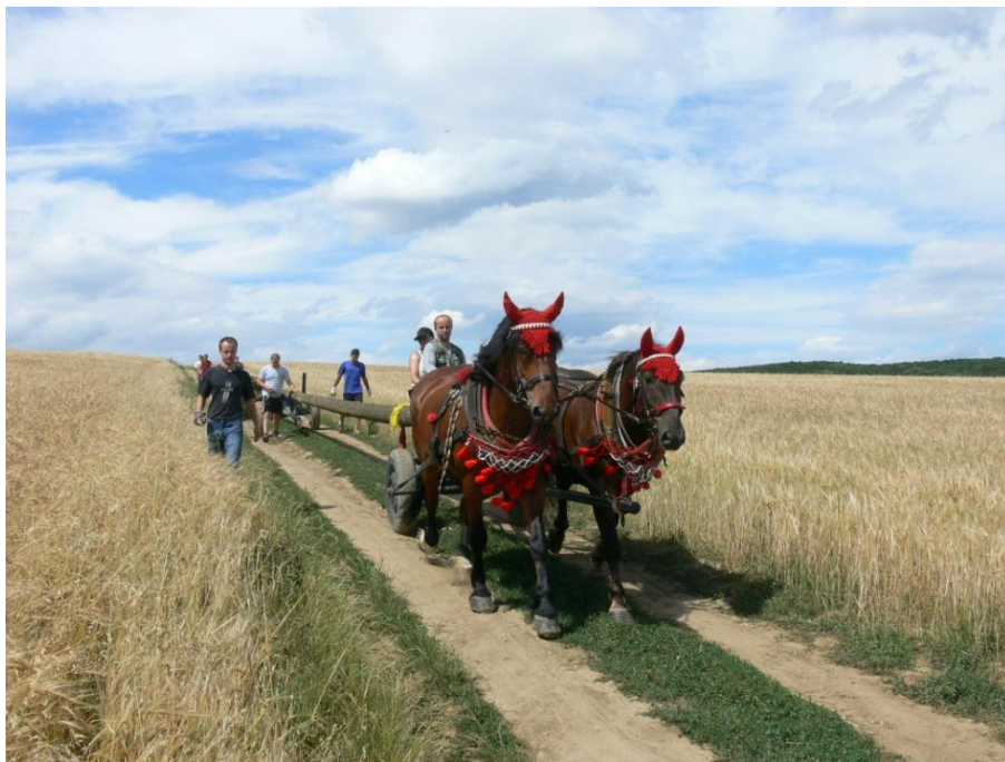
Máj bylo nutné dovézt až z komínských lesů...