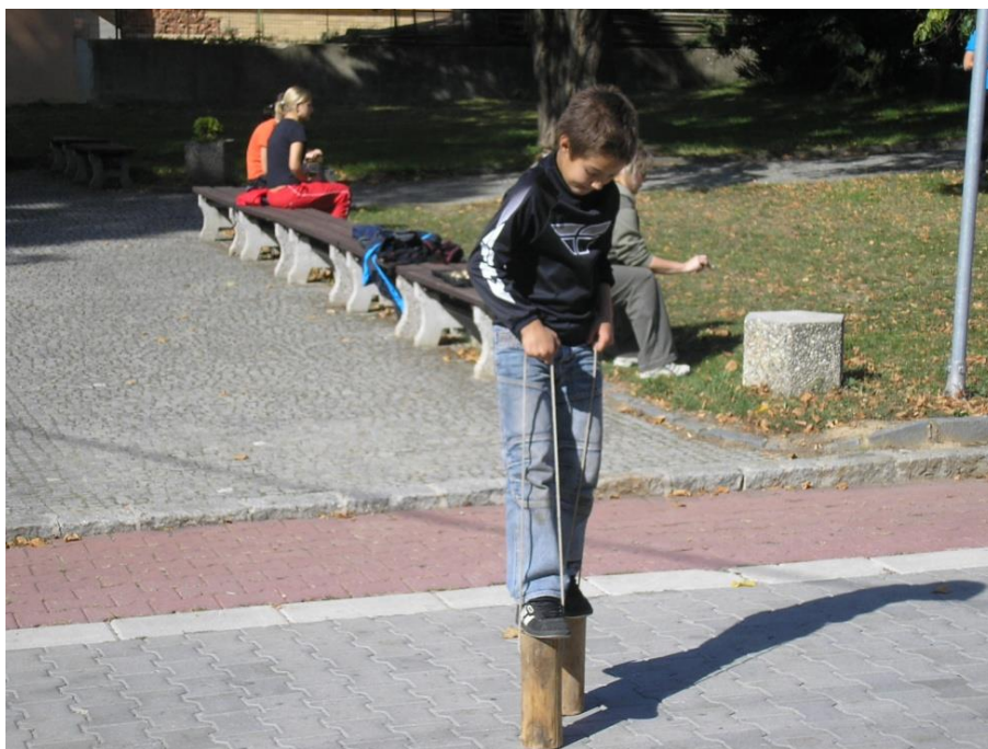
Chůzi na chůdách bylo třeba natrénovat...