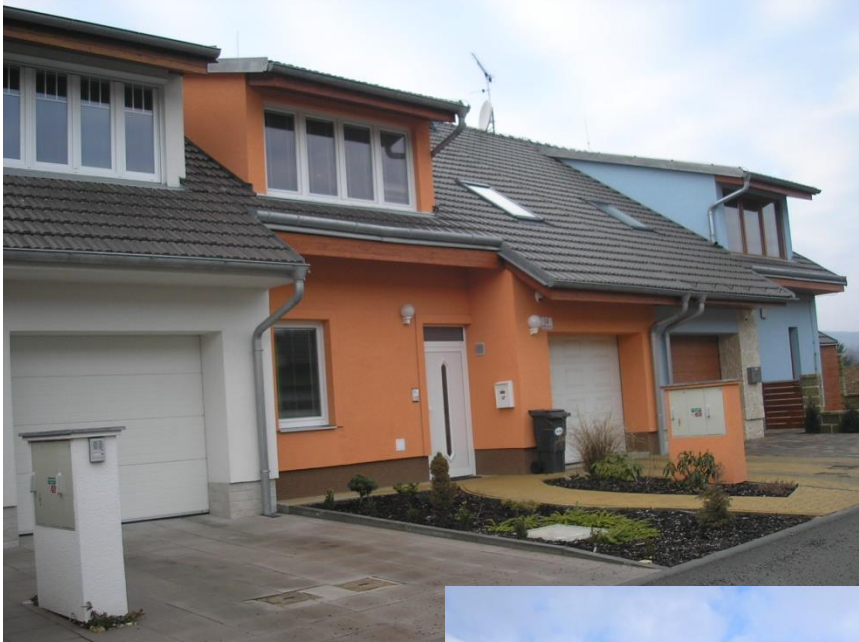
Řadové domky Ambrožovy ulice