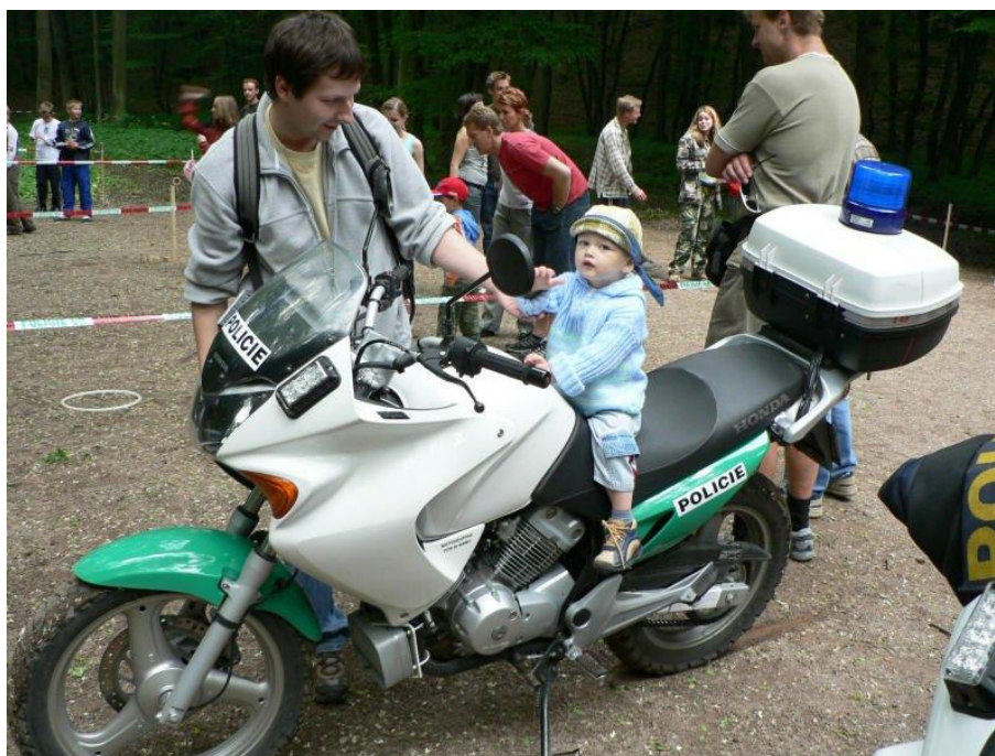
...i na motorce.