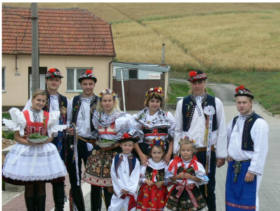
Jsme připraveni rozdat všechny rozmarýny a sousedy pozvat.