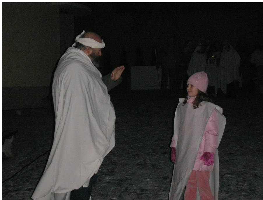
Starý rok předává vládu Novému.