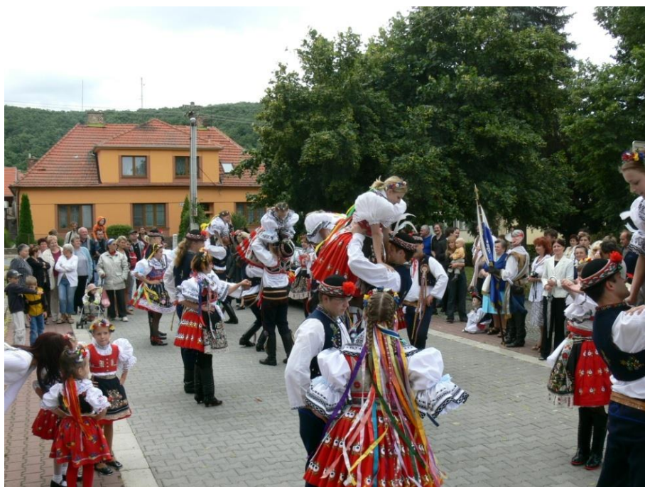
...a zatančením Moravské besedy u kaple.