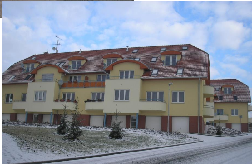
Bytovky na ulici Místní