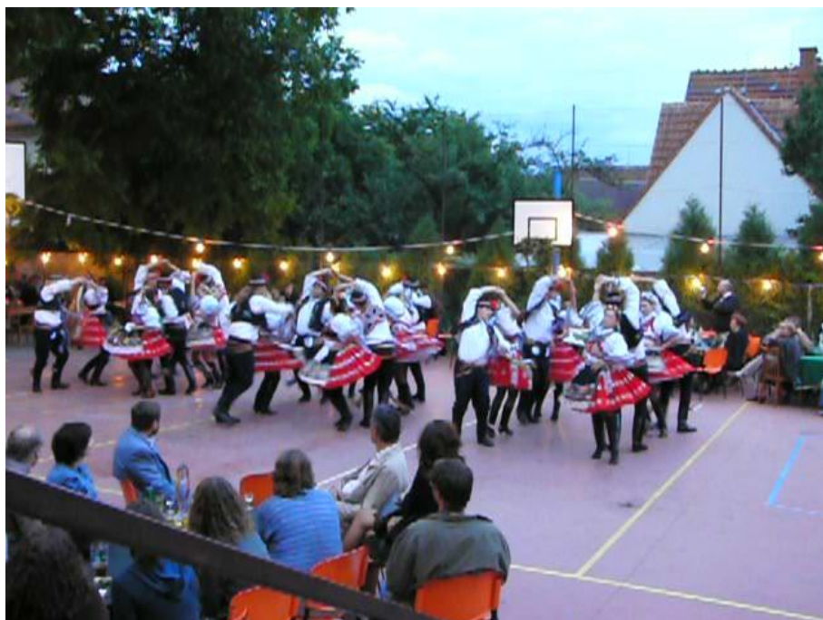
Večerní hodová zábava začíná zatančením Československé besedy