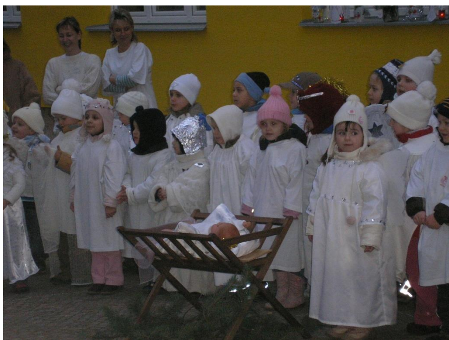
Tihle „andílci“ zazpívali rodičům o Vánocích před školkou koledy.