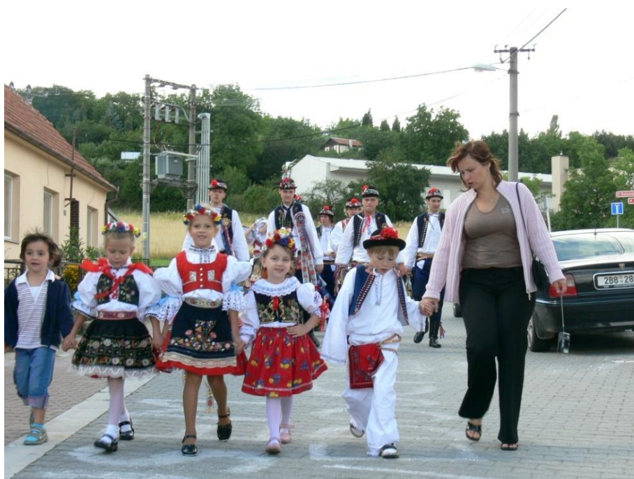
V čele odpoledního průvodu obcí šli ti nejmladší