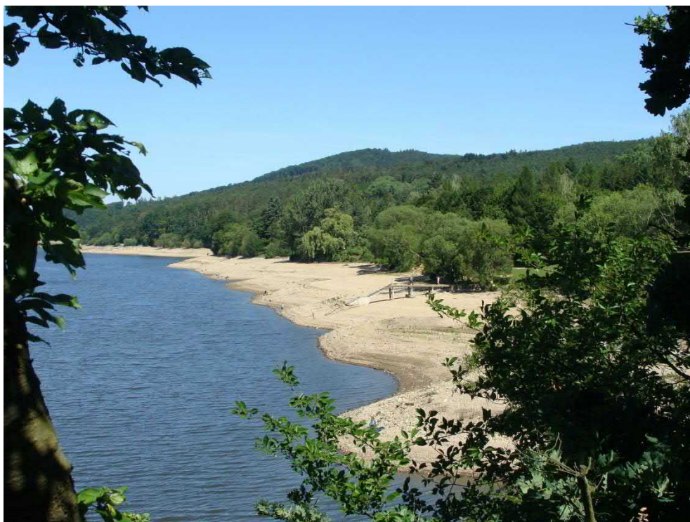
Odkryté pláže Sokolského koupaliště.