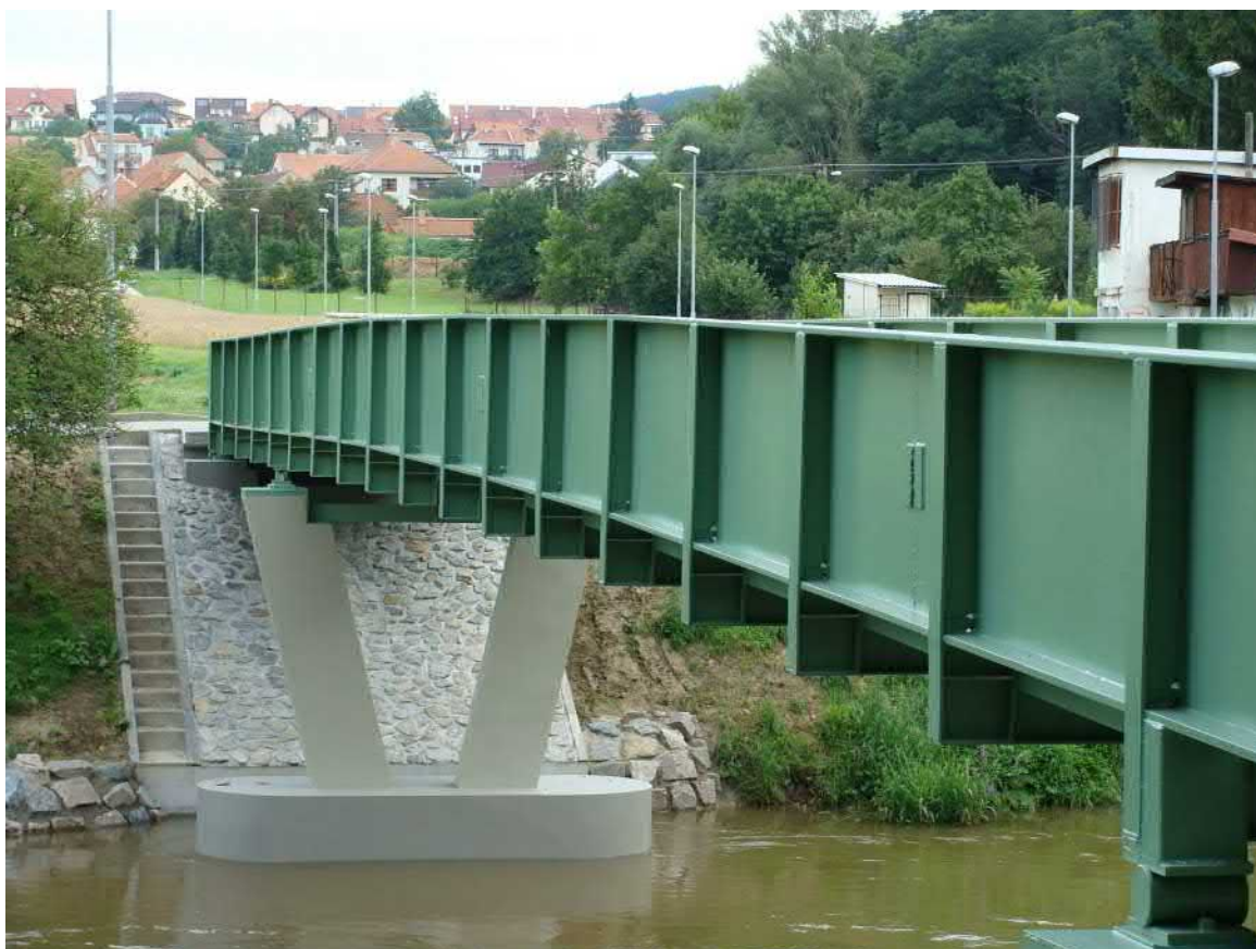
Lávka přes řeku dostala "nový kabát".

Zastupitelům a panu starostovi Bc. Martinu Žákovi se daří plnit úkoly, ke kterým se ve volbách zavázali. V obci přibylo zase několik dalších pěkných míst nejen pro obyvatele Kníniček, ale i pro přicházející návštěvníky.