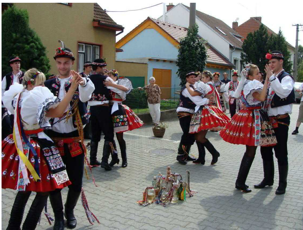
Jedno ze zastavení na ulici U Památníku. Do průvodu přibyla další stárka.