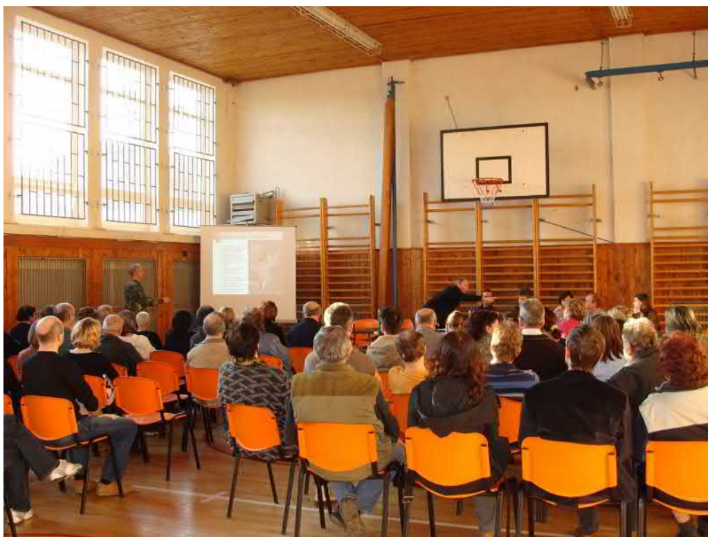
Ateliér Arch.Design představuje občanům a zastupitelstvu novou stavbu parkoviště.