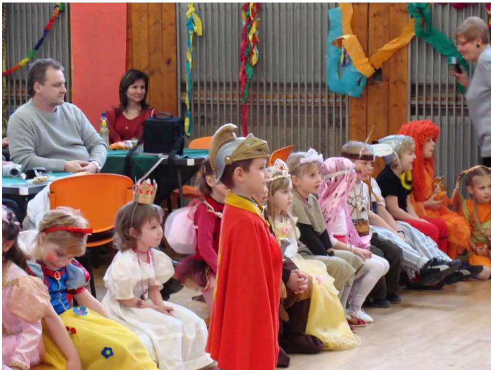
Princezny chránil statečný rytíř.