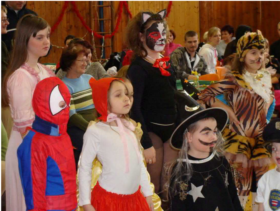
Velcí i malí čekali na losování tomboly.