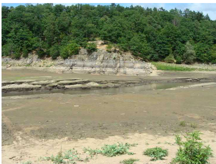
Řeka Svratka v Rokli