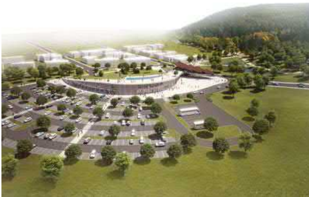
Návrh parkoviště s obřím akváriem.

Bouřlivou diskusi nad připomínkami občanů řídil pan starosta. Občané se bojí negativního vlivu na životní prostředí obce.