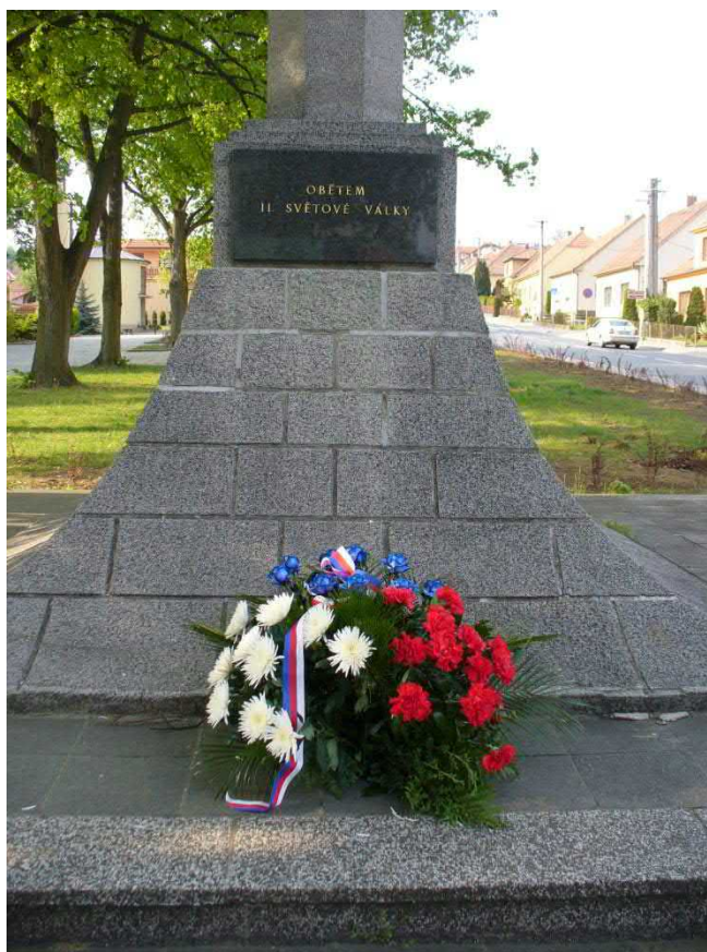
29. dubna starosta položil vzpomínkový věnec k Památníku obětem 2. světové války.