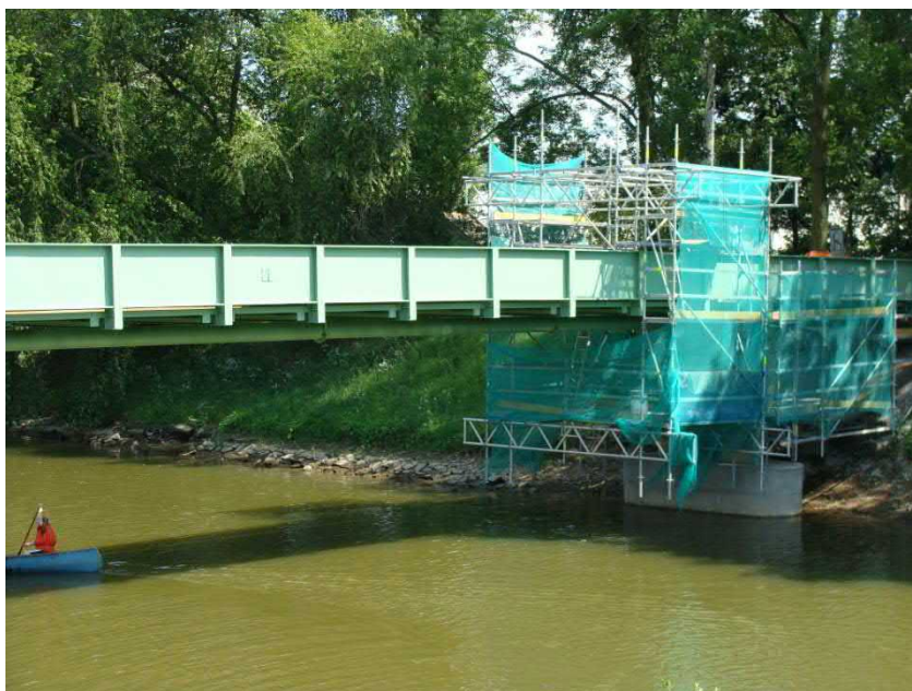
V květnu je uzavřena lávka přes řeku. Celá se opravuje.