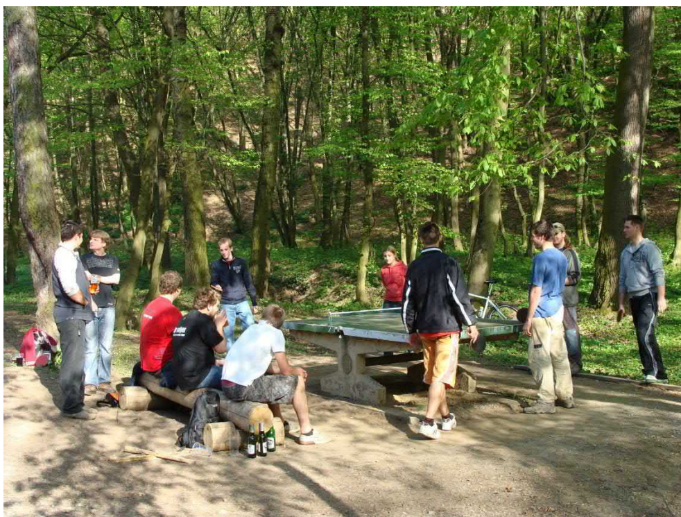
Zbyl čas i na sport.