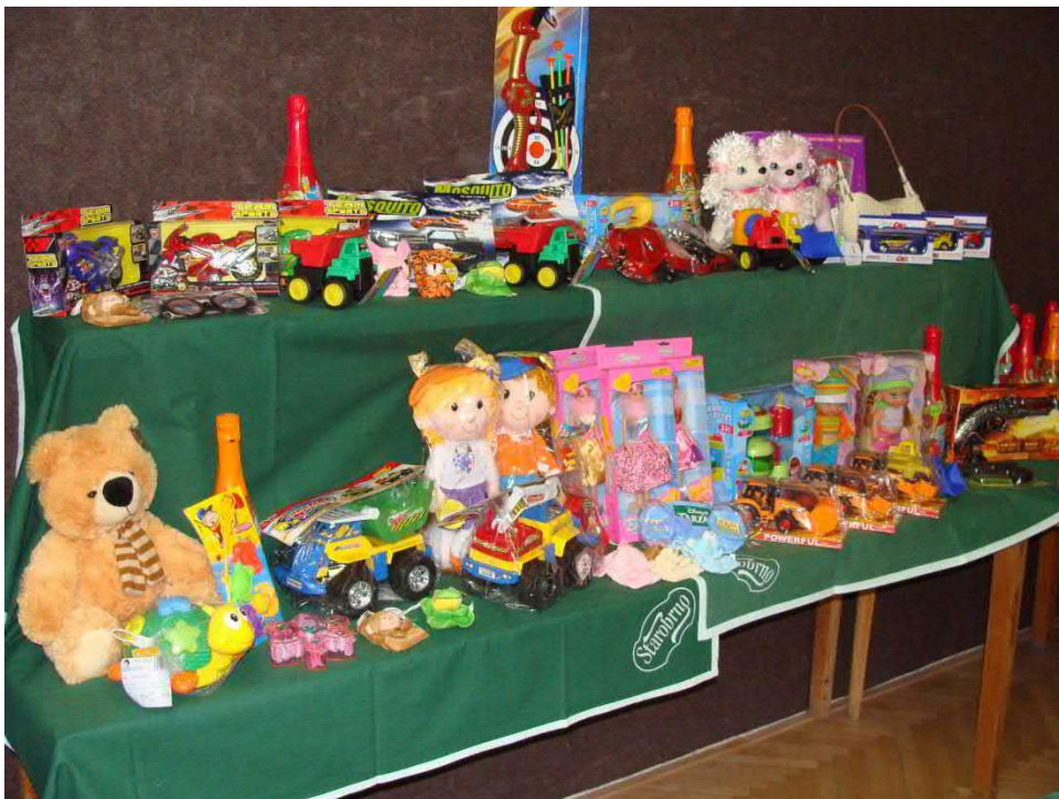
A bylo z čeho vybírat!