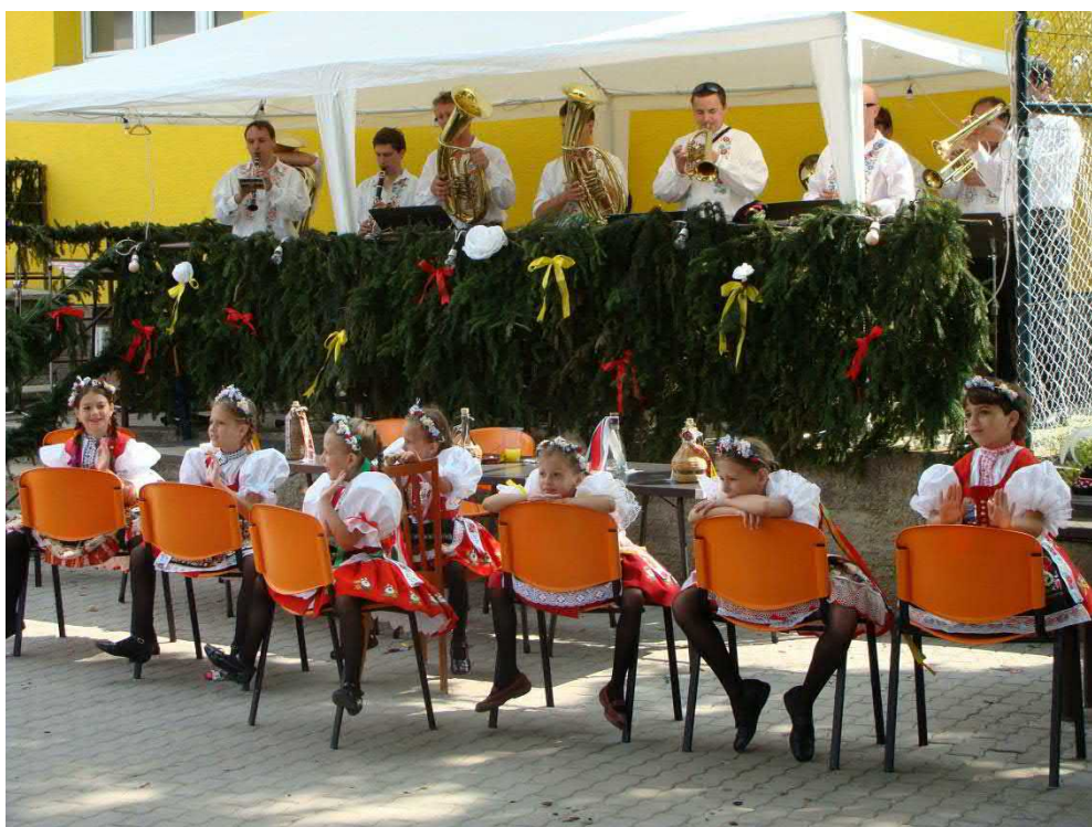
Ty nejmenší tanečnice sledují generálku a čekají na svou příležitost.