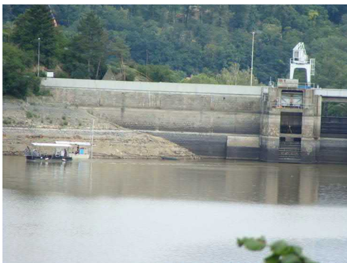
Hladina klesla o 10m