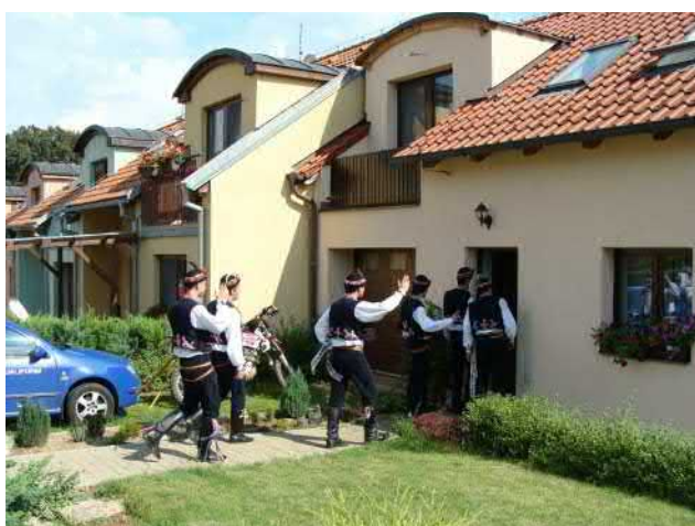
Je tam stárka? A ne jedna!