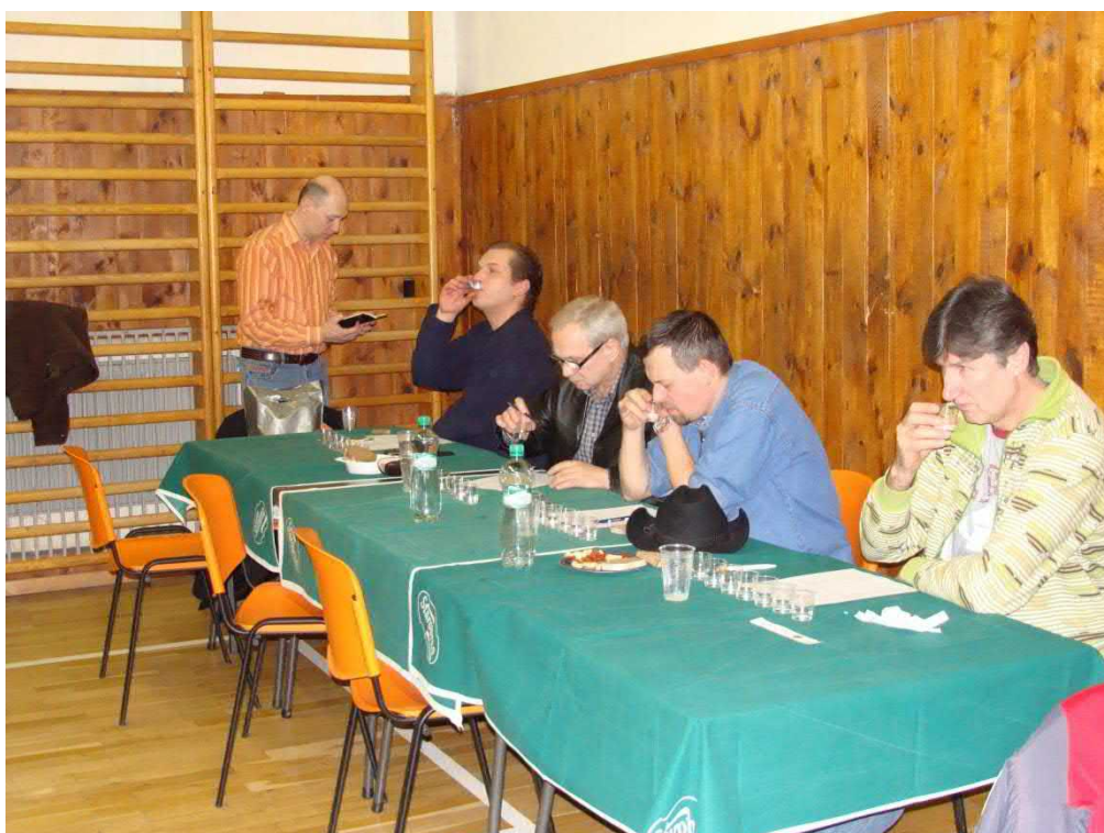
Není lehké se rozhodnout, která pálenka je lepší.