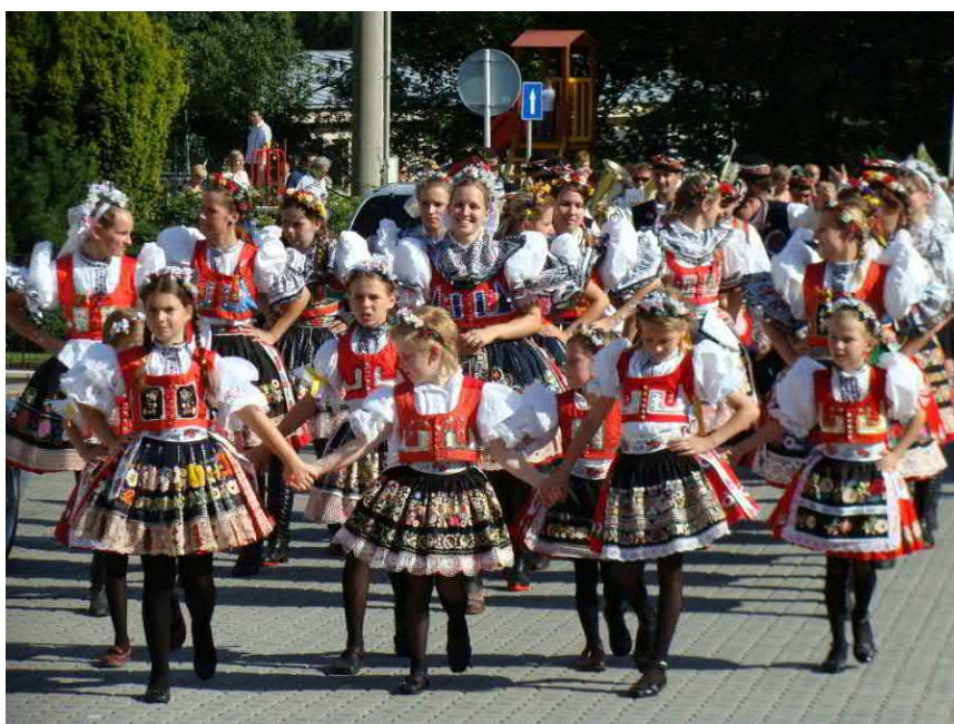
Po tradiční zastávce u cukrárny se jde k Liškům pro první stárku