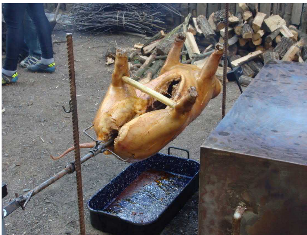
Po práci odměna...