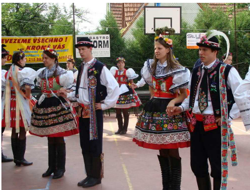
Poslední zkouška „nástupu“ na Moravskou besedu.

Sobotním odpolednem zněla celou obcí dechovka. Stárci uváděli svoje stárky a Zlaňanka jim vyhrávala do tance i do zpěvu. Šestnáct párů zakončilo průvod u první stárky, a to bylo u Lišků.