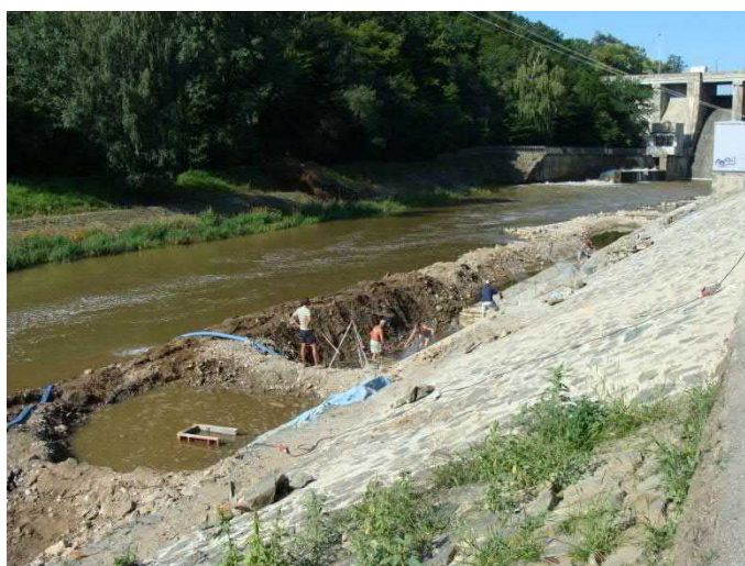
Probíhá oprava břehů Svratky