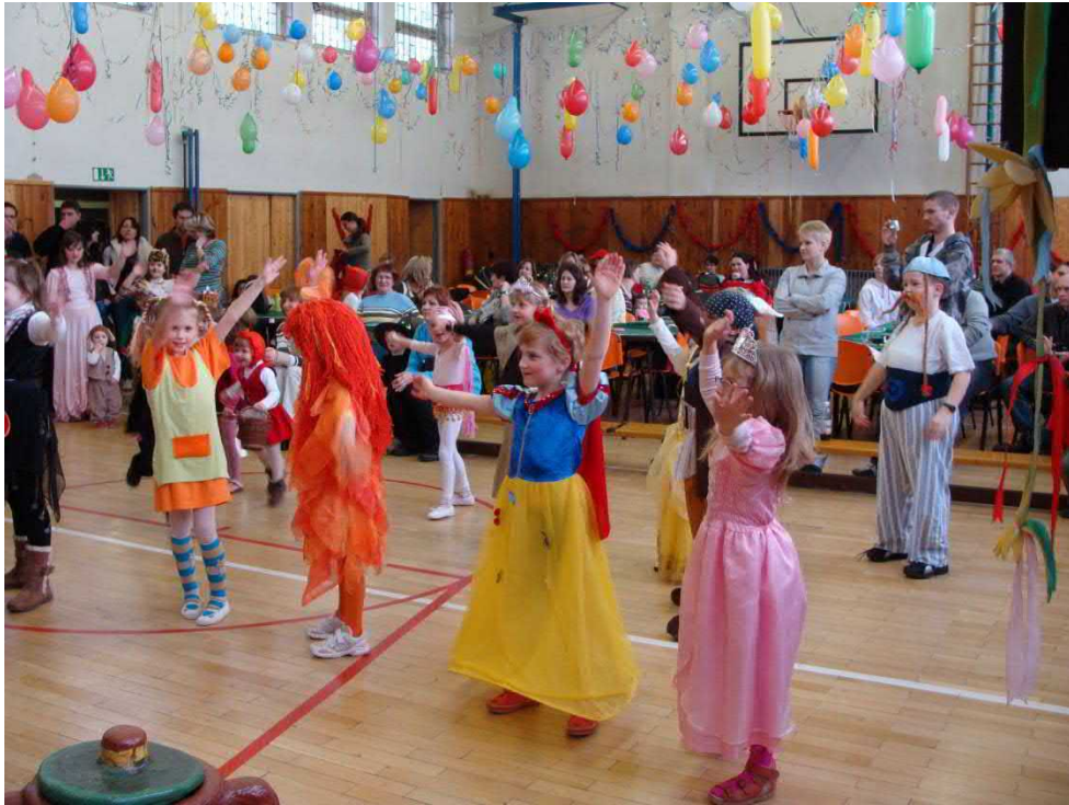
Tančilo se s velkou chutí, snažili se všichni.