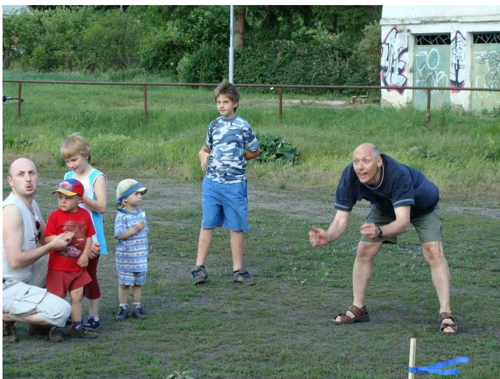
Který bratr zvítězí?