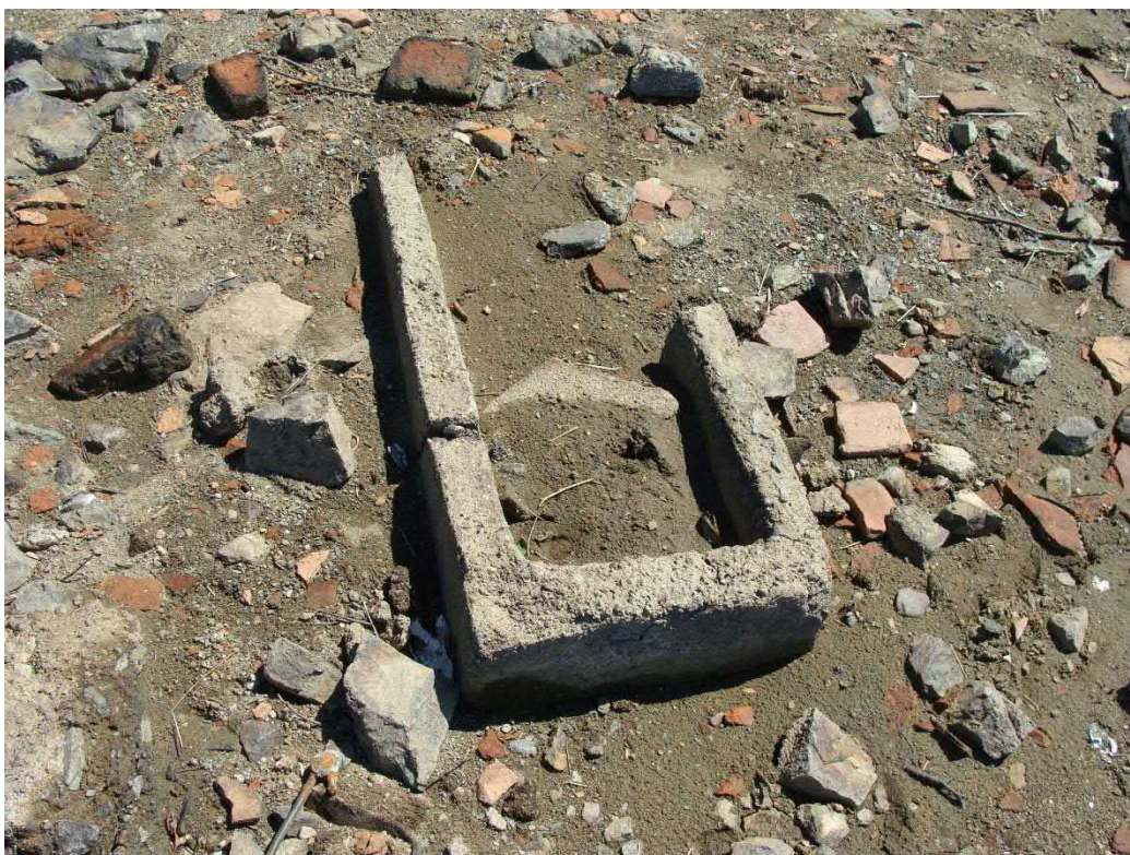
Snížená hladina odkryla pozůstatky starých „Kyniček“.