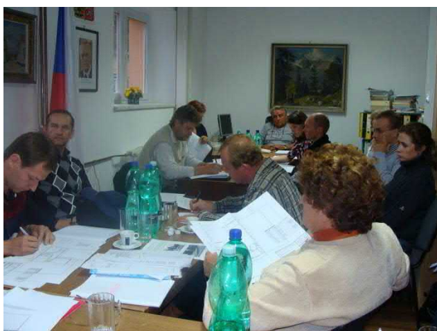
Pohled do zasedací místnosti při jednom zasedání zastupitelstva MČ Brno-Kníničky.