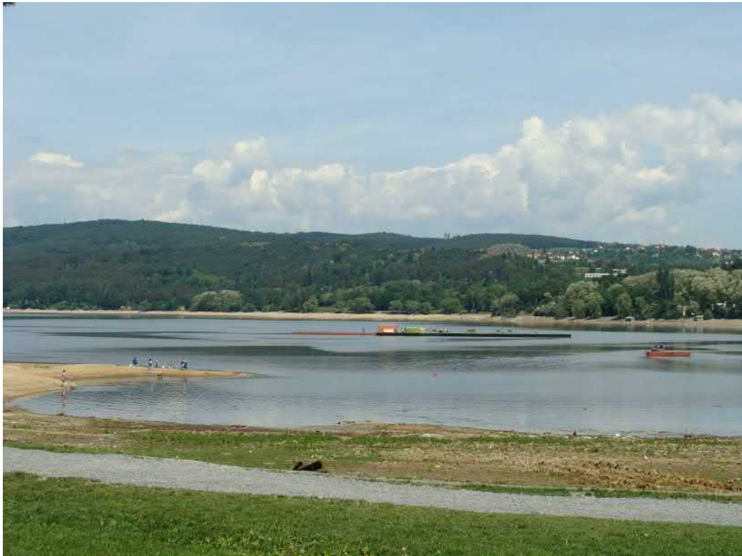
Pohled na vypuštěnou přehradu od Rakovce. Po ohňostrojích hladina ještě klesne.