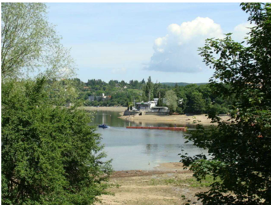
Příprava na ohňostroj.

Kníničský starosta pozval návštěvníky ohňostrojů na Sokolské koupaliště, kde hrála po všechny soutěžní večery country kapela Kompromis.