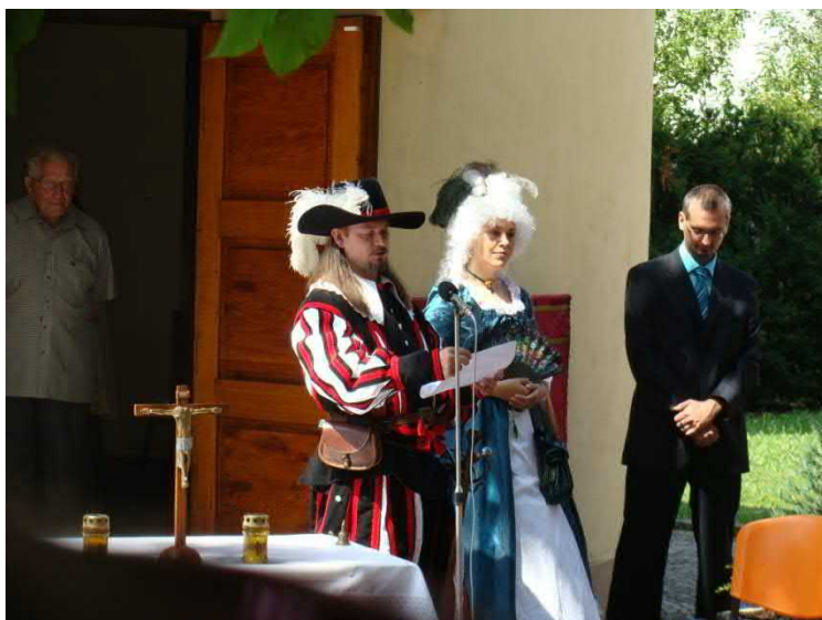
Udělení hodového práva.