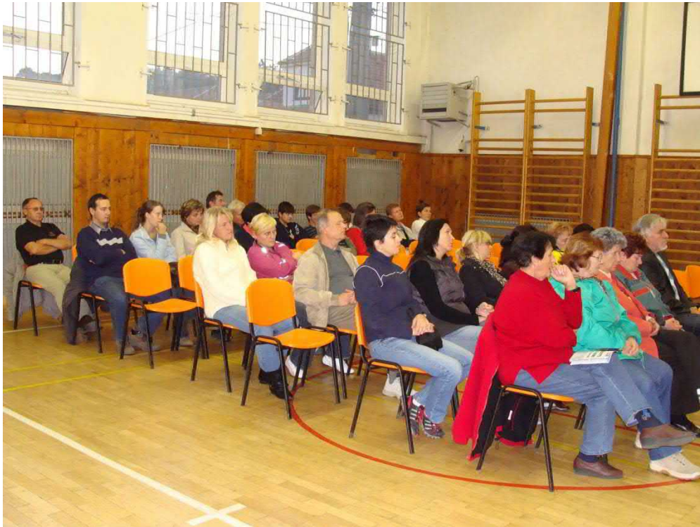
Poslední setkání s voliči uspořádala TOP09 v čele se stávajícím starostou.