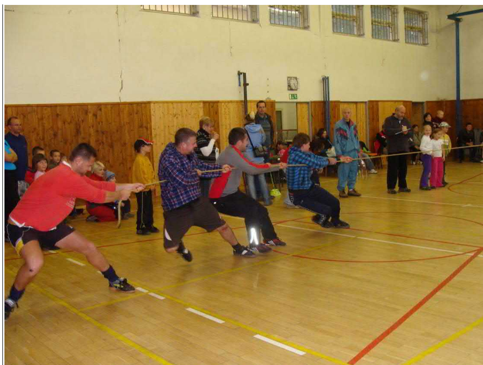
O lano se přetahovali jak dospělí, tak děti.