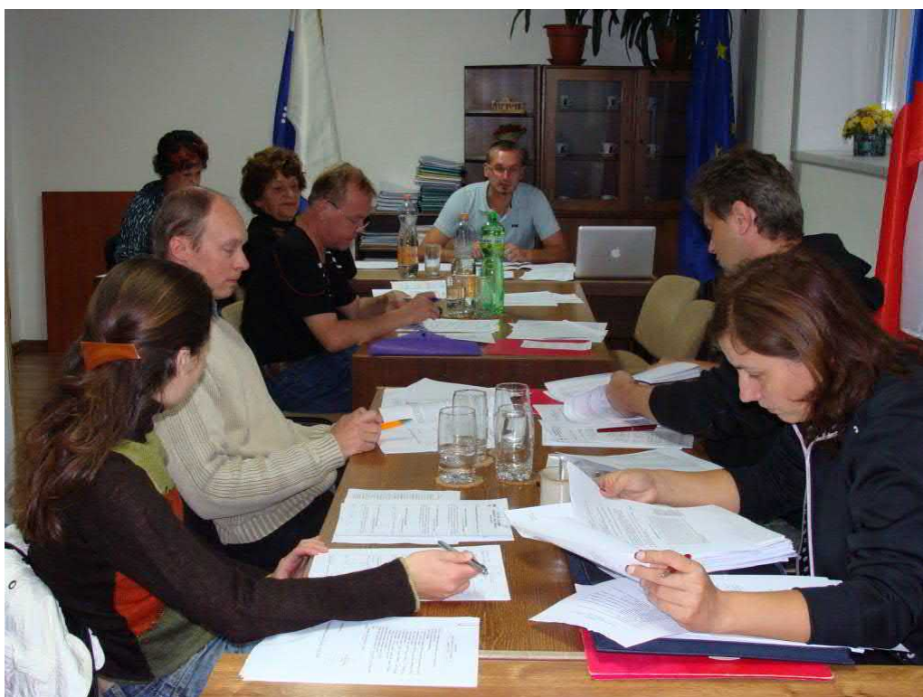
Poslední zasedání minulého zastupitelstva.