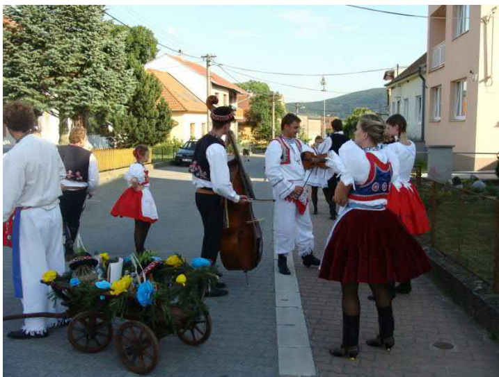
Předhodové zvaní a předhodová zábava s cimbálkou.