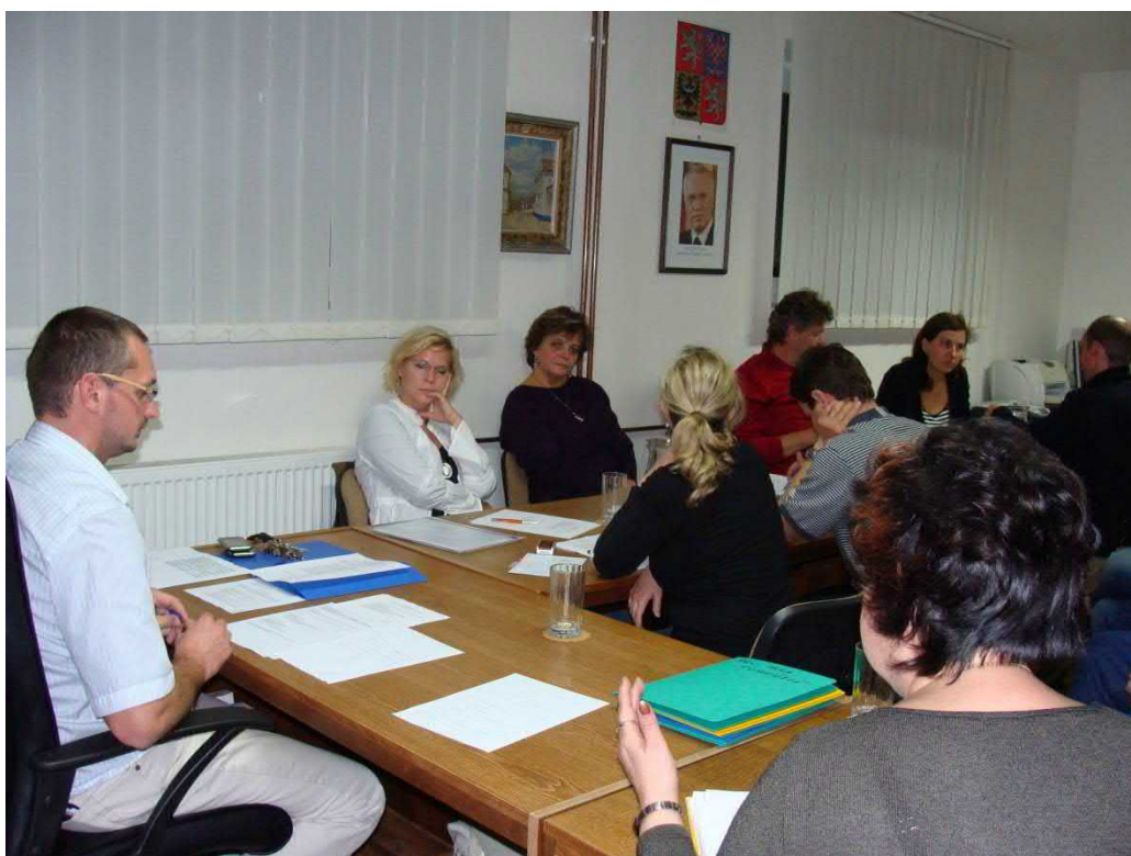
První zasedání nového zastupitelstva.