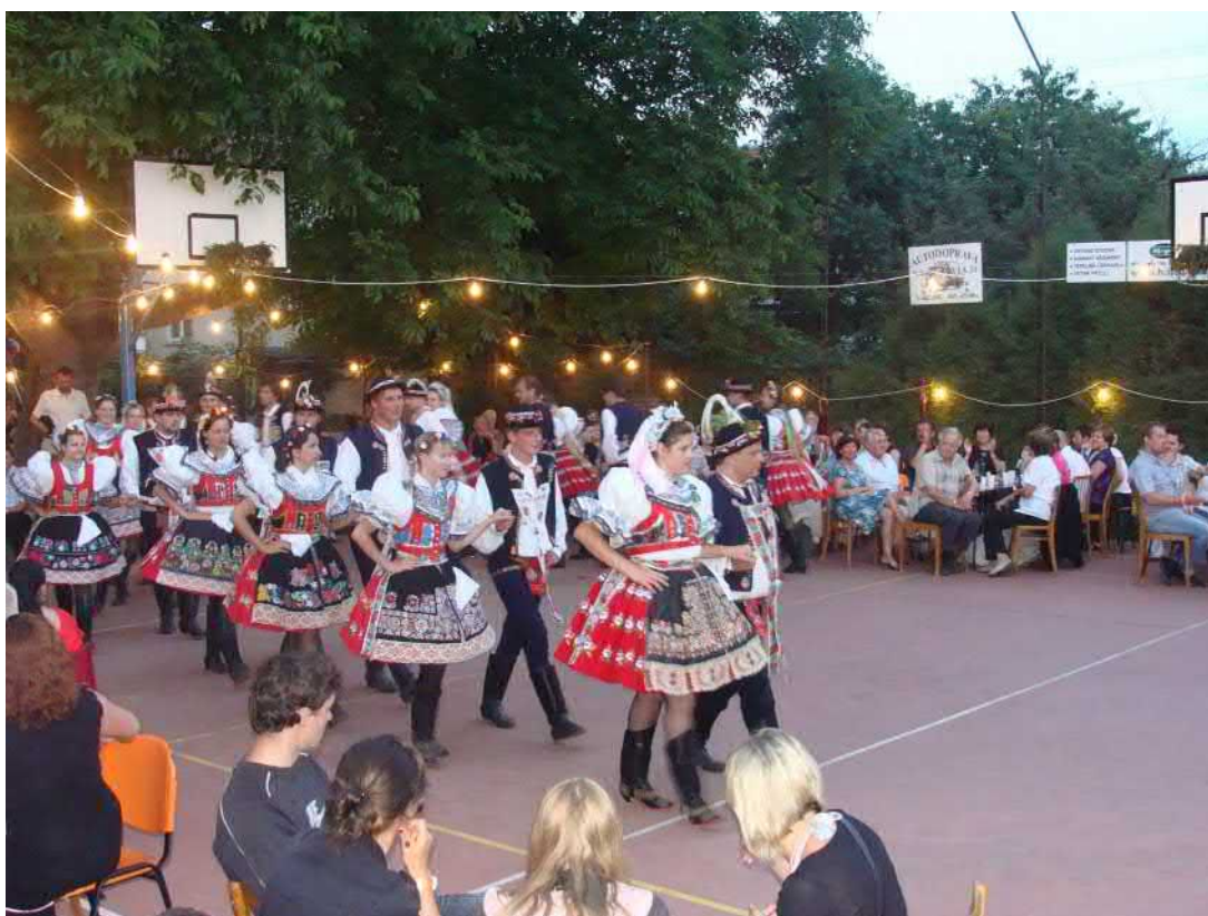
Je úžasné, že se našlo v naší obci tolik stárků a stárek, kteří nacvičili a předvedli hostům besedu. Všichni mohli jen obdivovat.