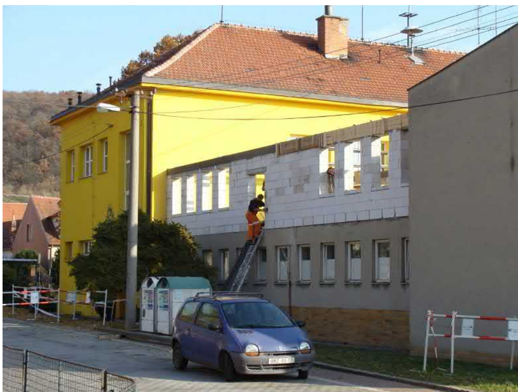
3. 11. 2010 Podzim se vydařil, a tak stavba roste.