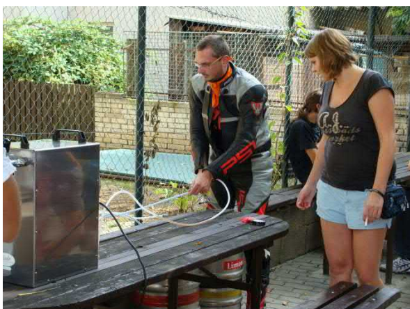
Pípu pomohl zprovoznit pan starosta.