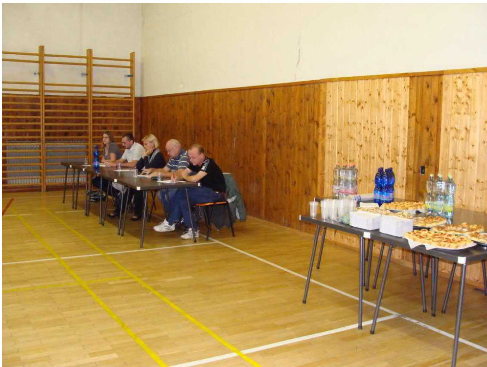
Ani na tomto setkání nechybělo občerstvení.