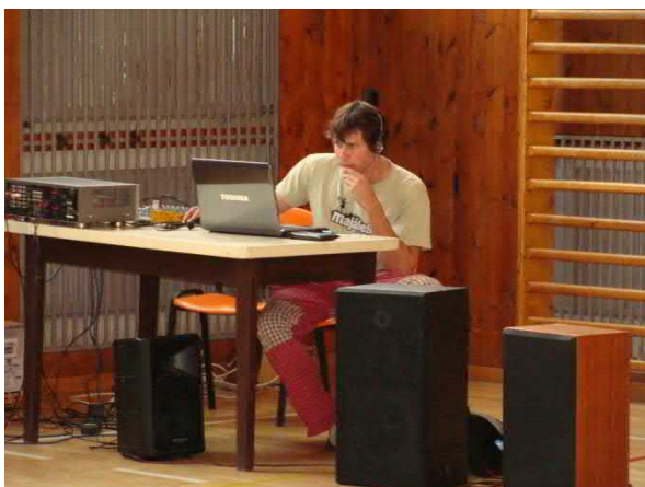
Je potřeba ještě nachystat aparaturu a pokladnu...