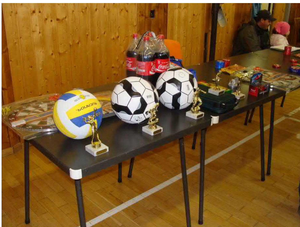
Po tvrdých bojích čekaly na vítěze odměny.