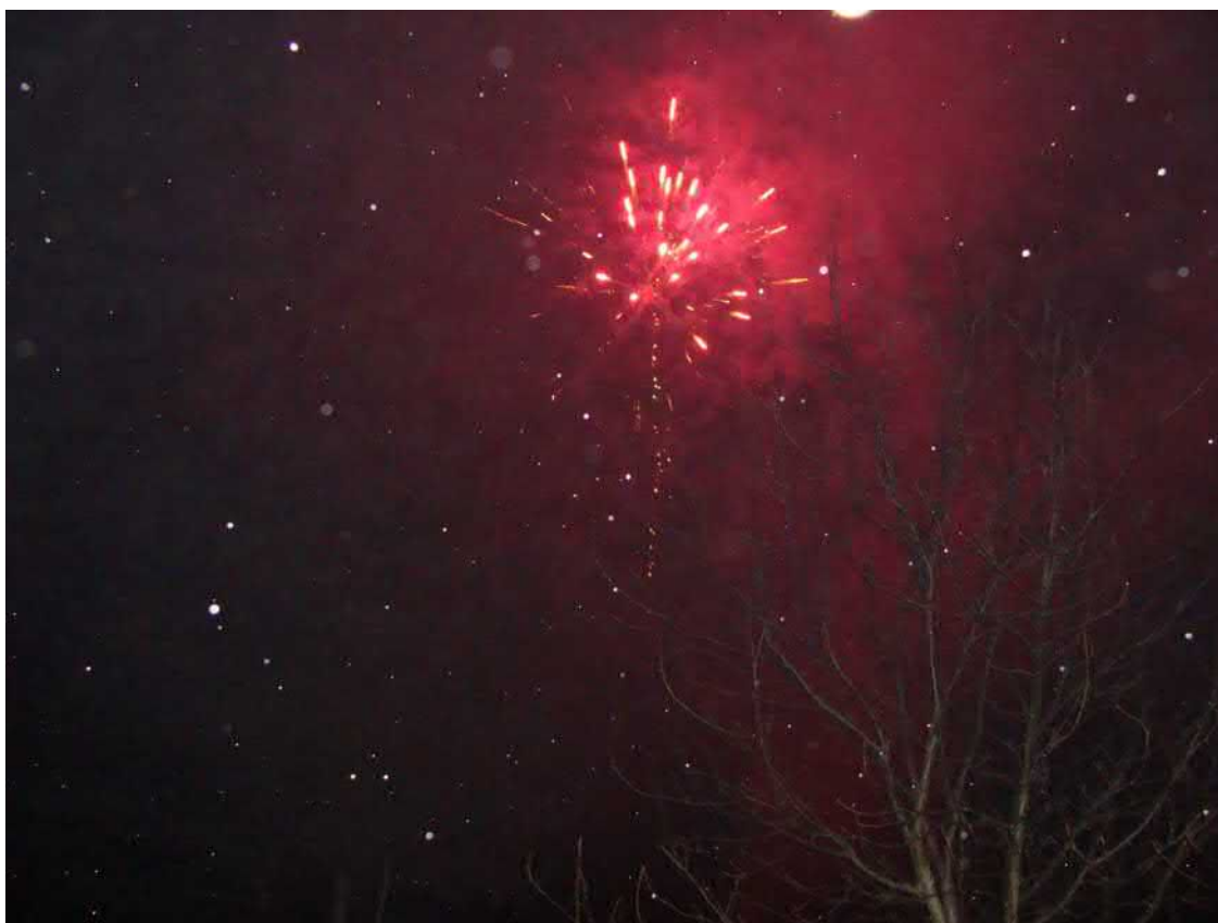
Byla to krásná podívaná.