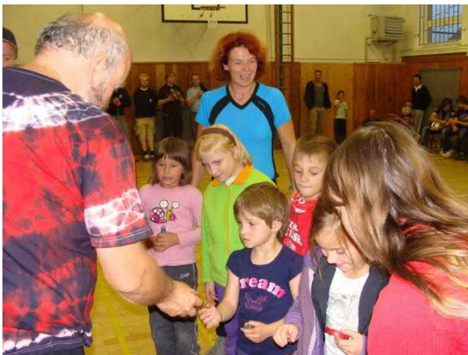
Radost z odměn měli malí...