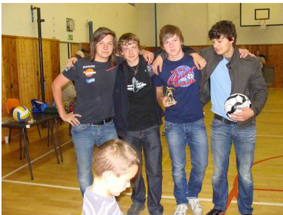
...i ti větší.