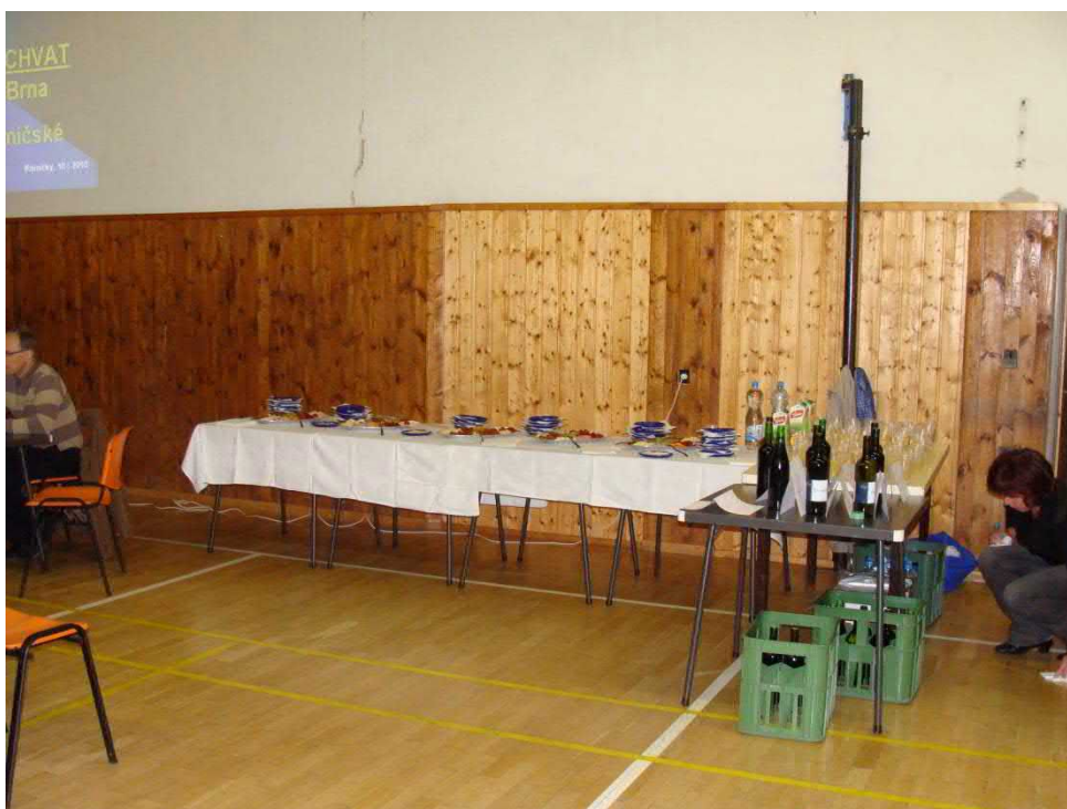
Podávalo se víno i burčák.