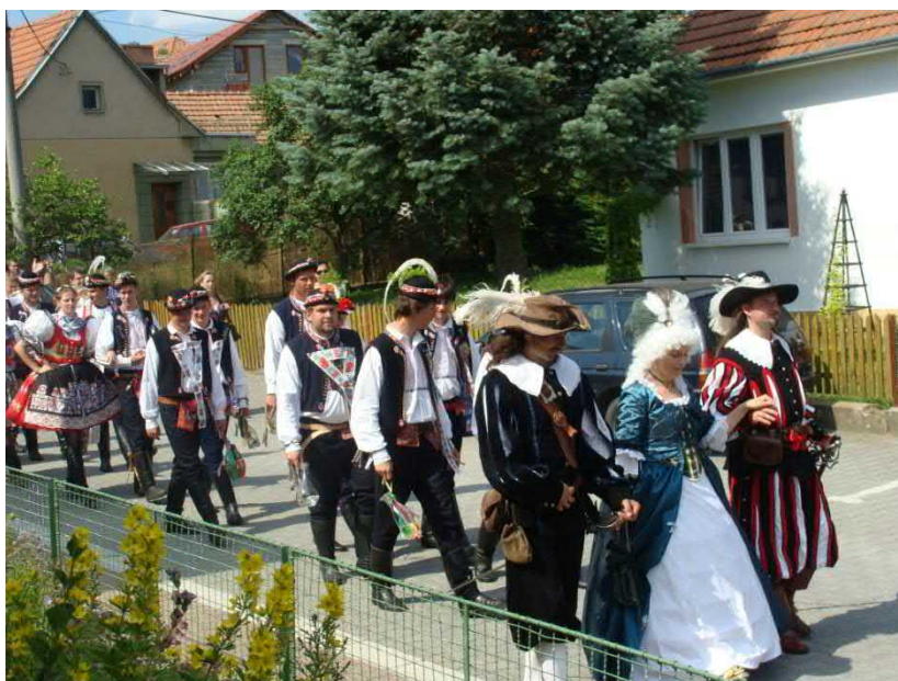
Uvádění stárek a večerní hodová zábava může začít.