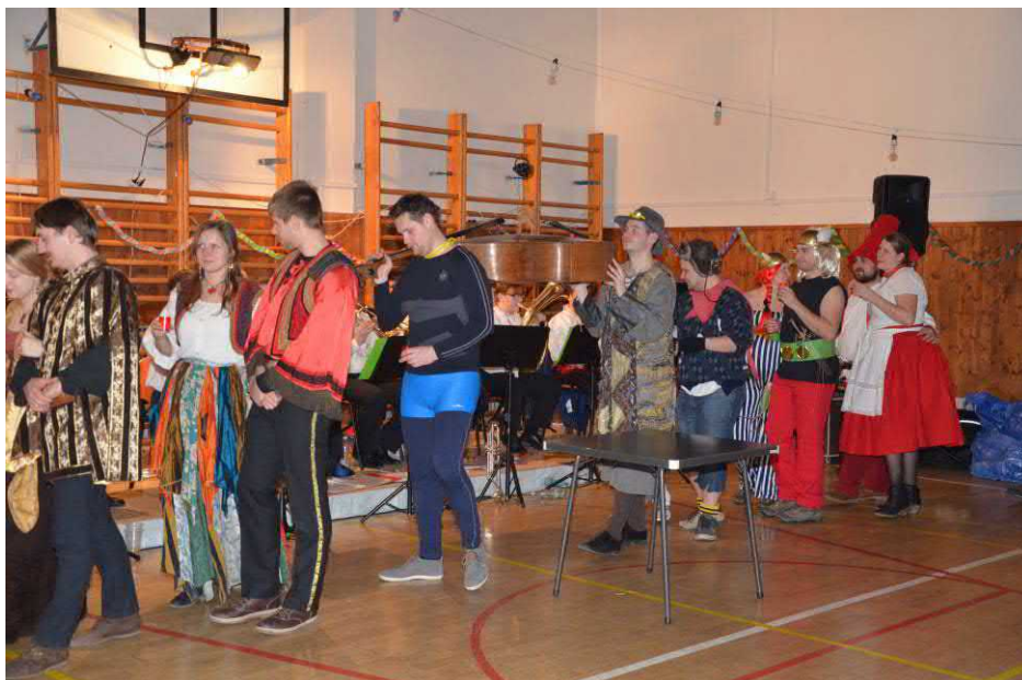
Průvod s basou