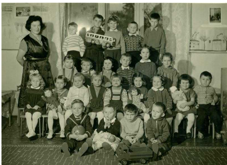
MŠ v letech 1959-60