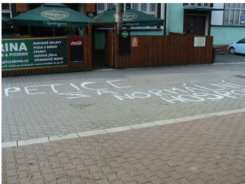
Ráno 1. máje ulice Kníniček zdobily nápisy např. „petice“ za otevření hospody