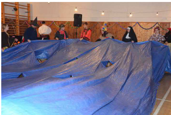
Příprava vodní plochy na vystoupení „akvabel“