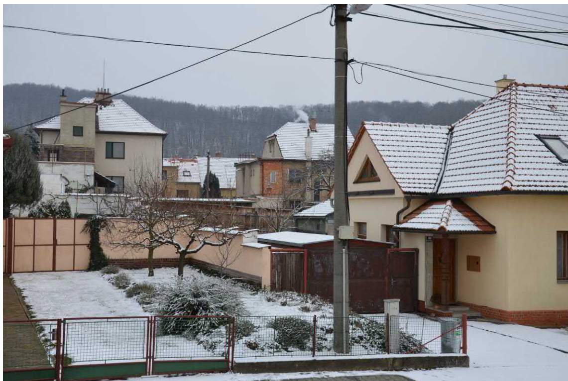
Lednová sněhová nadílka

Celý rok zápasili brněnští hygienici s epidemií hepatitidy typu A. Žloutenkou onemocnělo na jižní Moravě přes 400 lidí, byla to nejhorší epidemie za posledních 20let.