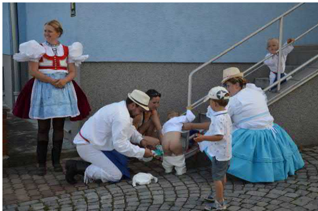
Nutná zastávka těch nejmenších účastníků průvodu...