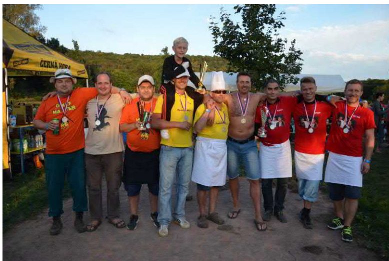
Vítězné tři týmy