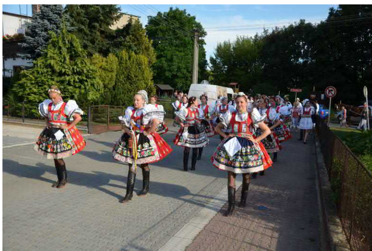
Už jsou všechny a průvod míří na hřiště