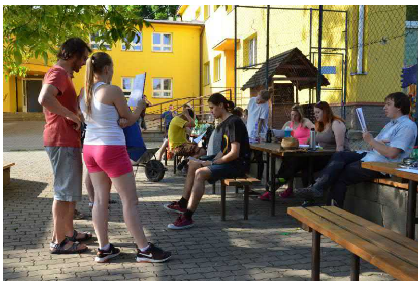
Nácviky besedy i opakování písní pro předhodovou zábavu je v plném proudu