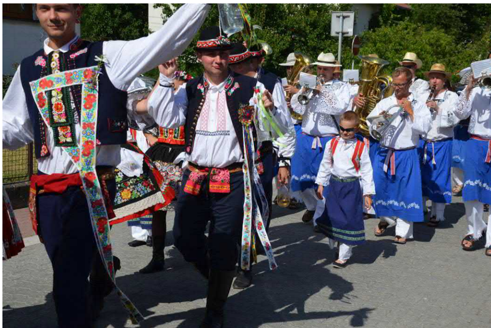
Odpolední průvod vyráží vyvést stárky