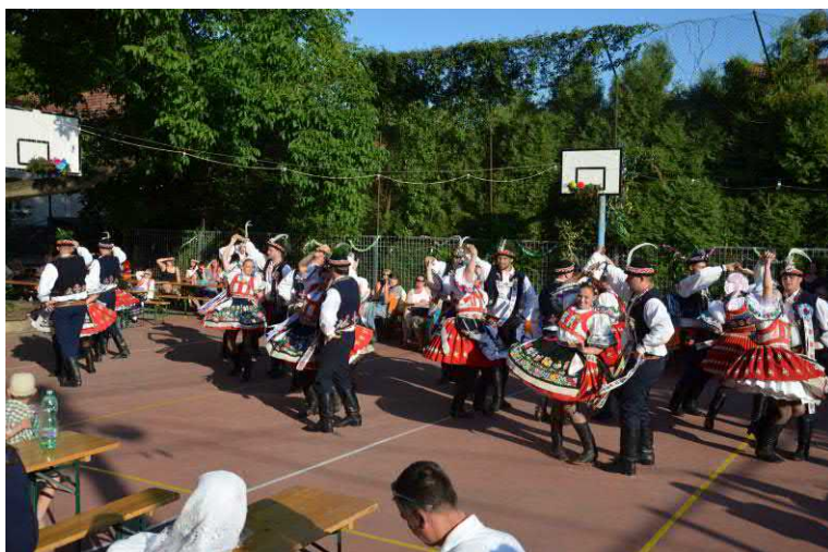
Krojovaný průvod končí zatančením Československé besedy