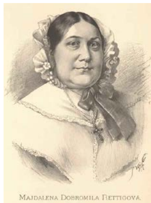
MAIDALENA DOBROMILA RETTIGOVA.

Vezmi pěknou svíčkovou pečení, všechny kůžičky z ní okrájej a nasol ji; vezmi ocet, dej do něj cibuli, dymíán, celý pepř, zázvor, nech to povařit, polej tím tu pečení, nech ji čtyry dny tak ležet, každý den ji ale musíš obracet. Pak ji vyslaň (vyšpekuj) jako zajíce, upeč ji, vlej pod ni tu omáčku a polívej ji kyselou smetanou; můžeš ji za pečení teplou i studenou požívat. Nebo pokrájěj ji, když pečená jest, na kousky, dej trochu strouhané smažené žemličky k tomu, vezmi dva žloutky, trochu kyselý smetany, dobře to rozkloktej, nech, co se ta pečeně pekla, s omáčkou tou povařit, pak to na tu pokrájenou pečení proced', dej trochu citronové kůry, a když to na stůl dáváš, naceď trochu citronové šťávy do toho. Dobrou chuť!